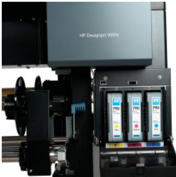
Suprimentos de Tinta HP