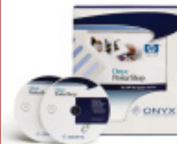
Onyx® PosterShop® 6.5 para HP DJ