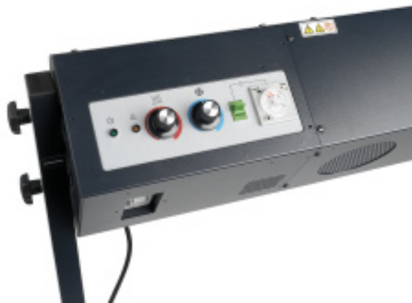
Detalhe dos controles variáveis

Com o secador de alta velocidade e o take-up reel*, é possível concluir trabalhos a uma taxa de até 98 m 2 /hora. O secador e o take-up reel integrados permitem impressões sem supervisão.