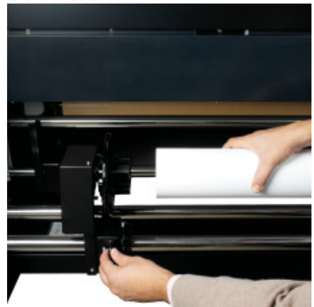
Fácil carregamento da mídia