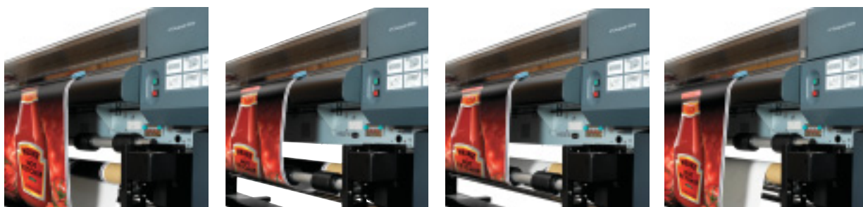
Detalhe do Take-Up Reel com quatro modos de bobinagem