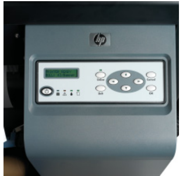
Painel frontal interativo