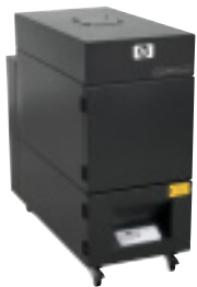
Sist. Purif. de ar da HP Designjet 9000s

A impressora HP Designjet série 9000s, os cartuchos HP com baixo teor de solvente foram todos projetados, planejados e testados em conjunto para assegurar sólida confiabilidade, qualidade de imagem, durabilidade, desempenho e facilidade de uso. A solução de impressão HP completa inclui estes acessórios: