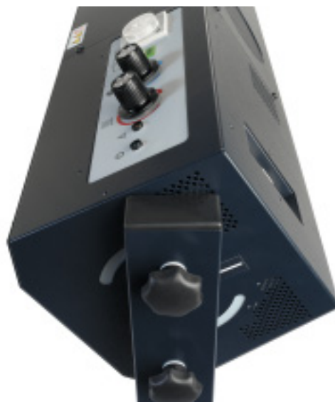
Ajuste do fluxo de ar do ventilador