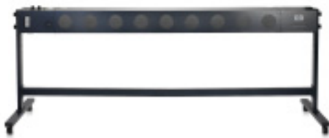
Secador de alta velocidade da HP Designjet