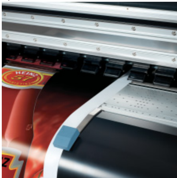
Sistema a vácuo ajustável